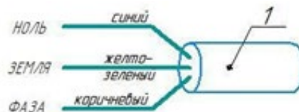
Рисунок 2 - Схема подключения к электросети

Внимание! Эксплуатация светильников без заземления не допускается! Корпус светильника электрически связан с проводом заземления кабеля питания. При этом, корпус светильника и кронштейн имеют изоляционное покрытие.