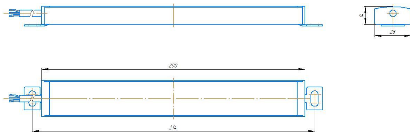
Рисунок 2 — Конструкция светильника.

На внутреннем основании алюминиевого корпуса смонтирован светодиодный модуль и бездрайверный источник тока светодиодов. Для защиты от загрязнений и равномерного рассеивания света используется светорассеиватель. Монтаж светильника на предполагаемую поверхность осуществляется с помощью подвижных монтажных элементов, входящих в конструкцию светильника.